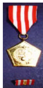
Wiratama Tingkat III Wiratama Tingkat II Wiratama Tingkat I