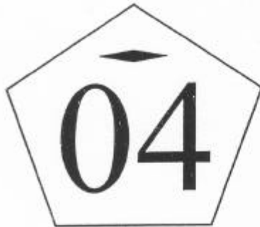
Tanda Sah Ukuran : 6 mm, 4 mm dan 2 mm

LAMPIRAN KEPUTUSAN MENTERI PERINDUSTRIAN DAN PERDAGANGAN RI NOMOR : 522/MPP/Kep/8/2003 TANGGAL : 29 Agustus 2003