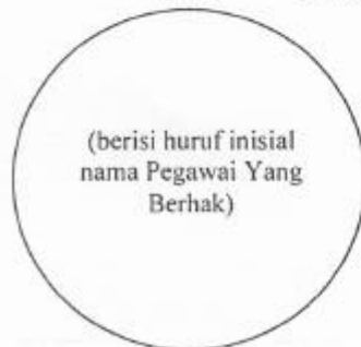
Tanda Pegawai Yang Berhak Ukuran : 8 mm, 5 mm dan 4 mm

MENTERI PERINDUSTRIAN DAN PERDAGANGAN REPUBLIK INDONESIA