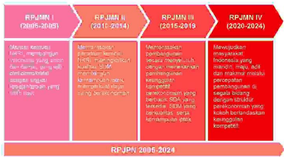
Sumber: RPJPN 2005-2025

Penyusunan arah kebijakan dan strategi nasional dalam RPJMN 2015-2019 berpedoman pada RPJPN 2005-2025 sebagaimana tertuang dalam UU Nomor 17 Tahun 2007. Untuk pelaksanaannya, RPJPN 2005-2025 dibagi dalam empat tahap, yakni RPJMN I (2005-2009), RPJMN II (2010-2014), RPJMN III (2015-2019), dan RPJMN IV (2020-2024). Masing-masing tahap memiliki tujuan pembangunan nasional sebagaimana terlihat pada Gambar 3.