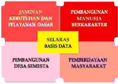
Gambar 4. Lima Fokus Koordinasi Kemenko PMK

Pemberian nomor pada masing-masing fokus, bukanlah sebuah indikasi urutan penyelenggaraan fokus dalam koordinasi PMK. Kelima fokus dimaksud untuk membuat kategori pemusatan perhatian pada keseluruhan PMK yang melibatkan banyak K/L. Berikut titik-titik pusat koordinasi dalam kerangka pembangunan manusia dan kebudayaan: