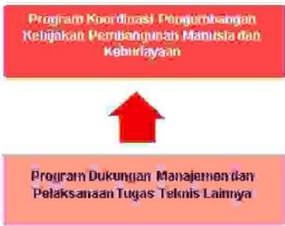
Gambar 5. Hubungan antara Program Teknis dengan Program Generik

Program teknis Kemenko PMK akan memayungi berbagai kegiatan-kegiatan koordinasi, sinkronisasi, dan pengendalian (KSP) yang dilaksanakan oleh unit kerja Deputi yang melaksanakan lima tahapan proses bisnis dari Kementerian Koordinator Bidang Pembangunan Manusia dan Kebudayaan, yaitu: penyusunan program dan kegiatan, identifikasi masalah, pelaksanaan KSP, monitoring dan evaluasi, serta penyusunan rumusan kebijakan. Sedangkan Program Generik merupakan dukungan manajemen dan pelaksanaan tugas teknis lainnya di lingkungan Kemenko PMK yang mencakup fungsi-fungsi pengelolaan pengembangan dan manajemen sumber daya manusia, manajemen bisnis dan proses organisasi, manajemen aset dan sarana kegiatan, pelayanan kehumasan dan hukum, manajemen keuangan, penyusunan program kerja, serta penyelenggaraan pendidikan dan pelatihan. Program generik melaksanakan empat tahapan proses bisnis, yaitu: persiapan, pelaksanaan, monitoring dan evaluasi, serta penyusunan laporan. Hubungan antara program teknis dan program generik Kemenko PMK dalam rangka pencapaian tujuan dan sasaran strategis Kemenko PMK diperlihatkan pada Gambar 5.