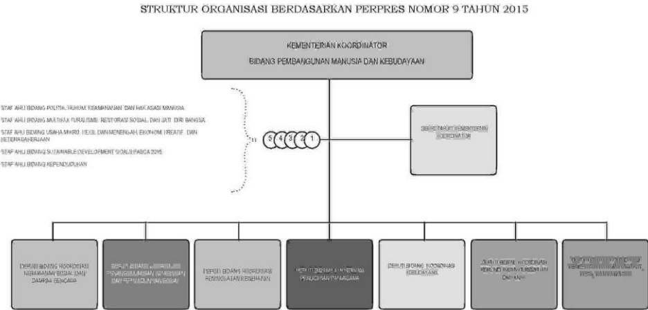
Lampiran 4 Kerangka Kelembagaan